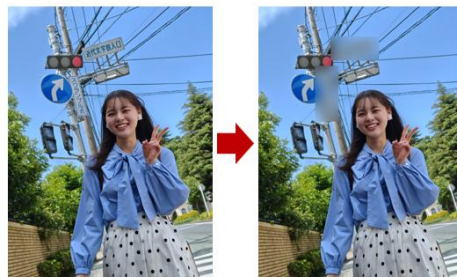
写真の中の文字をAIが検出してマスキング