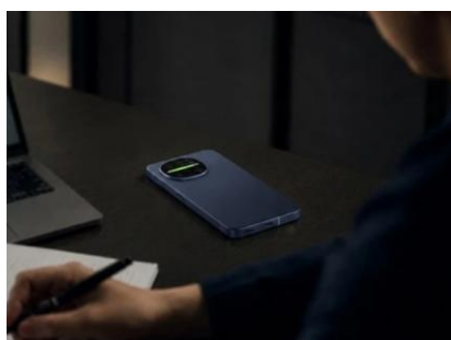
灯りと音が連動して空間演出（イメージ）

本体のデザインは、デザイナー三宅 一成氏が設立した「miyake design」が監修。カメラリング部は、円でも四角でもない“自由曲線”が印象的なデザインを継承しています。光沢感のあるガラス素材と丸みを帯びたフォルムで、手に馴染みやすくシンプルながらも上質感のあるデザインです。カラーは個性が際立つ3色をラインアップしました。