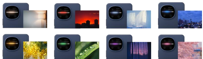
自然界の色合いをモチーフにした8色（イメージ）