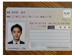
マイナンバーカードは 「性別」「臓器提供意思」をマスキング