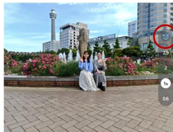
AIが被写体を認識すると アイコンが青色へ

加えて、集合写真の撮影時には、複数カットから全員が目が自然に開いた1枚を生成するほか、書類の撮影時には写り込んだ影の除去や台形補正により、文字を見やすく残せます。