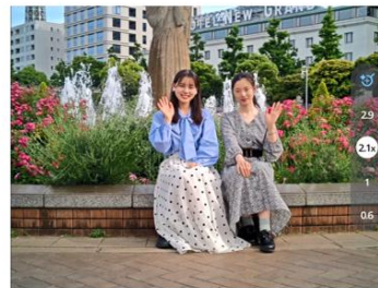
青アイコンをタップすると 最適ズーム